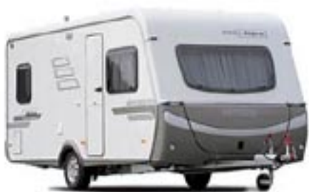
HYMER Eriba Nova