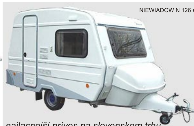
NIEWIADOW N 126 e

ceny a detaily nájdete na našej internetovej stránke