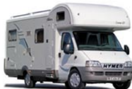
HYMER Camp GT